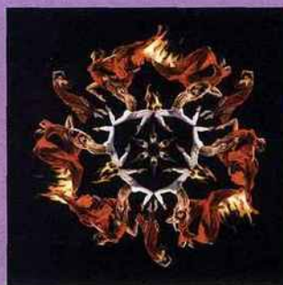
Figure de la passion.