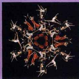
La jalousie par le Ballet de Hambourg.