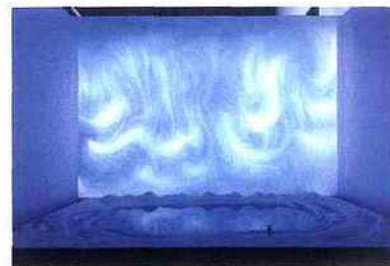
Solveig, landscape of my memory de Leonid Tishkov, artiste russe exposé à Enghien.

certaines de ses pièces captées pour l'écran, dont son célèbre Hommage à la Argentina . Également des documentaires permettant d'approcher sa personnalité et son œuvre. Rens. : 01 44 75 42 77.