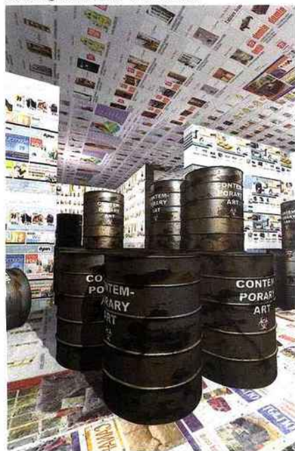
MAURICE BENAYOUN Dump to Recycle , 2011

Médiathèque George Sand • 5-7, rue de Mora 95880 Enghien-les-Bains • 01 34 28 45 91