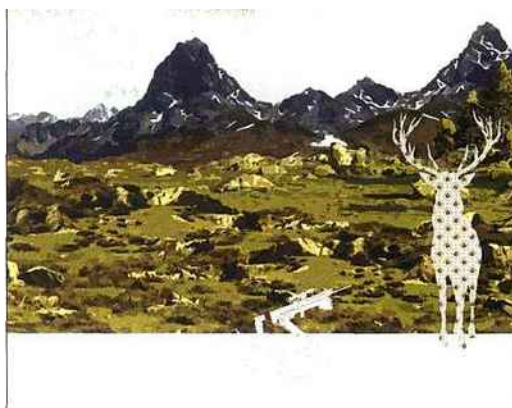
LIONEL LOETSCHER Scène de montagne